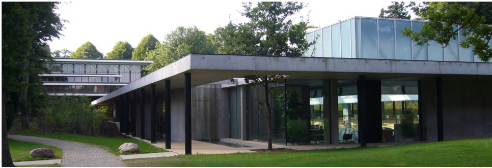
Kildeskovshallen, 1972. Tilbygning, 2001