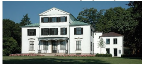
Øregaard Park og Museum