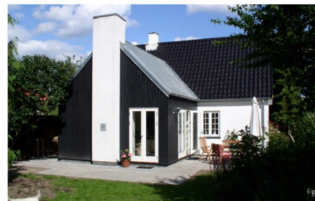
Tilbygning der både er i overensstemmelse med vores tid og samtidigt afpasset den ældre

I projekter på eksisterende bebyggelse kan energioptimering udføres på arkitekturens præmisser, således at bygningen opretholder sine arkitektoniske kvaliteter og eventuelle kulturarvsværdi. Der er f.eks. mange muligheder for effektiv efterisolering, bl.a. kan de oprindelige vinduer ofte forbedres frem for udskiftes.