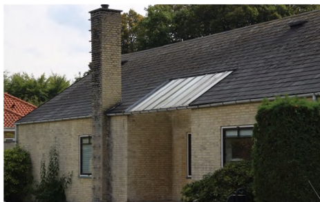
Villa fra 1940'erne. Tidstypisk nordisk modernisme,

Uanset om det er ny arkitektur eller projekter på eksisterende bebyggelse, er målet, at arkitekturen er velfungerende, giver muligheder for alle ("universelt design"), løser opgaven og måske endda tilbyder mere end det. Dette for individet såvel som for fællesskabet. Funktionen skal ses i perspektivet fra både nutidens og fremtidens brugere.