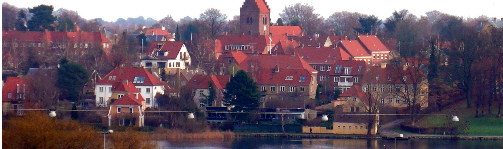
Gentofte sø, by og kirke