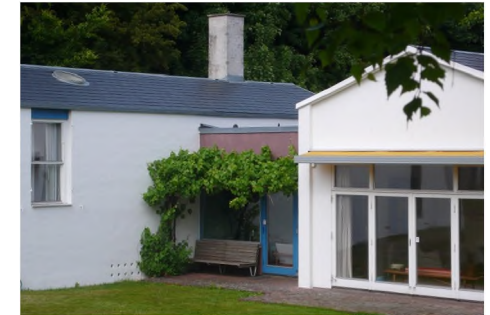
Finn Juhs hus