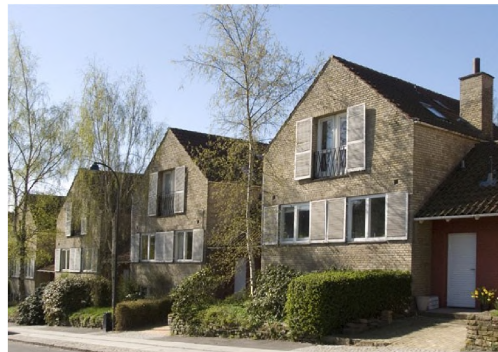
Skjoldagervej. Kædehusbebyggelse tegnet af arkitekt Svenn Eske Kristensen i 1943

Det er forhåbningen, at den arkitektoniske udvikling fortsat vil være præget af kvalificerende istandsættelser og forbedringer af de gamle huse. Eller, når det er velbegrunderet at bygge nyt, at der tilstræbes vellykket arkitektur, som passer til stedet, og som er et godt eksempel på vores tid og formåen.