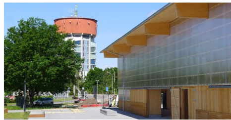
Skaterhal og Jægersborg Vandtårn