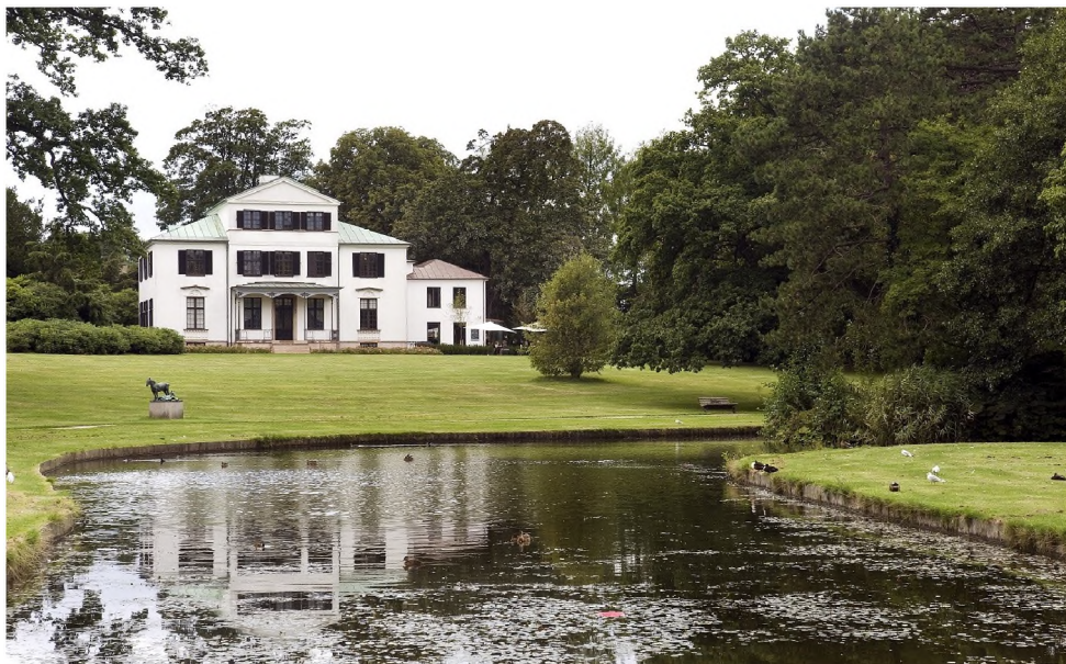
Øregaard Park og Museum. Tegnet af Joseph-Jacques Ramée i 1806