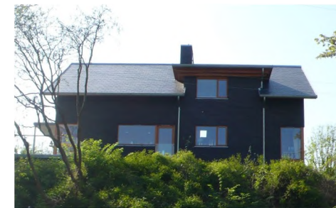
Villa 2009. Tidstypisk og samtidigt inspireret af traditionen og indpasset i miljøet.

Det er en arkitektonisk kvalitet, når former og materialer både har gode egenskaber og giver sansestimulerende oplevelser.